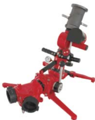
Style 625-2 可携式自动摇摆水炮