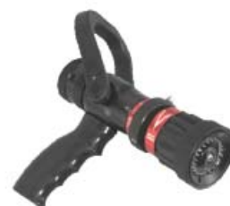
Style 2360 & 2361