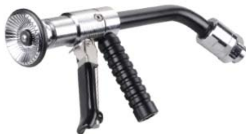
Style 305 高压板机调整水枪