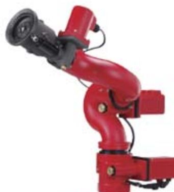
Style 933 无线遥控水炮