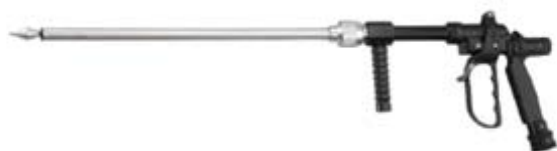
Style 304 高压穿刺水枪