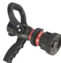
Style 2365 & 2366