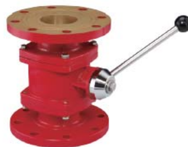
Style 560 球阀炮座