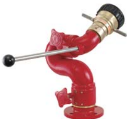
Style 648 固定式水炮