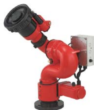
Style 955 大流量遥控水炮