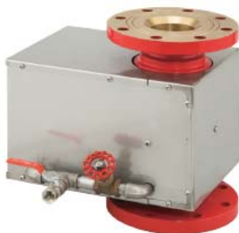
Style 916 自动摇摆炮座