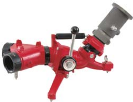
Style 600-2 可携式移动水炮

For high performance fire fighting equipment, visit www.protekfire.com.tw