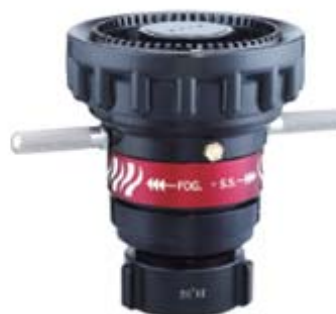
Style 832 自动调整流量喷嘴