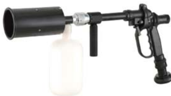
Style 204 高压自吸式泡沫枪