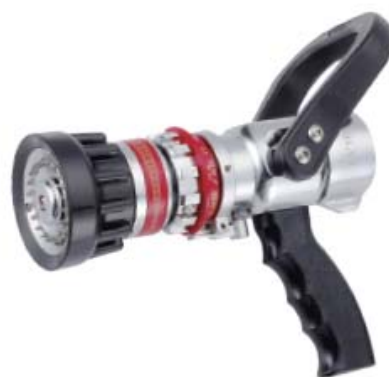
Style 366-BCSP 海事用可调流量水枪