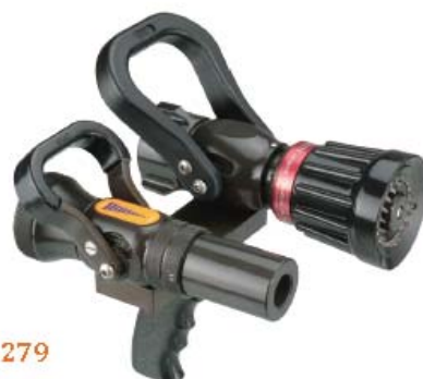
Style 277 & 279